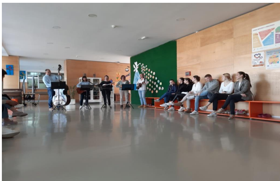
Στο σχολείο Tomislav Spoljar, με σχολικό προσωπικό και το διευθυντή (στο μπάσο) να υποδέχονται τους συμμετέχοντες του study visit, με ένα παραδοσιακό Κροατικό τραγούδι.