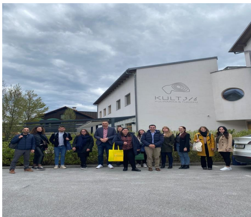
Έξω από τη σχολή KULT316

Το πρόγραμμα της πρώτης μέρας ολοκληρώθηκε με επίσκεψη στο Biotechnical Educational Centre Ljubljana and KULT316 , μια δημόσια σχολή δευτεροβάθμιας τεχνικής εκπαίδευσης που προσφέρει επίσης βραχυπρόθεσμα προγράμματα τριτοβάθμιας εκπαίδευσης και προγράμματα εκπαίδευσης ενηλίκων. Η σχολή παρέχει ευκαιρίες φοίτησης σε προγράμματα εκπαίδευσης του βιοτεχνικού τομέα (π.χ. τεχνολογία τροφίμων, βιοτεχνολογία, τεχνικοί κτηνιάτρων), τουρισμού και φιλοξενίας, αρτοποιία, ζαχαροπλαστική, κ.α. Μετά από ξενάγηση στις εγκαταστάσεις της σχολής, έγινε παρουσίαση από το σχολικό προσωπικό, αναφορικά με το ρόλο που διαδραματίζει το συμβουλευτικό κέντρο σταδιοδρομίας (career centre) στη συνεχή υποστήριξη των μαθητών κατά τη διάρκεια της φοίτησης τους, σε σχέση με την προετοιμασία τους για την ομαλή ένταξη στην αγορά εργασίας. Η υποστήριξη αυτή περιλαμβάνει εκτός από την καθοδήγηση στη σύνταξη βιογραφικού, την ανάπτυξη δεξιοτήτων αναζήτησης εργασίας, την προετοιμασία για συνεντεύξεις, την προβολή και προώθηση του εαυτού σε δυνητικούς εργοδότες, και την καλλιέργεια δεξιοτήτων ζωής (life skills), που συμβάλλουν στο κτίσιμο μιας ολοκληρωμένης προσωπικότητας.