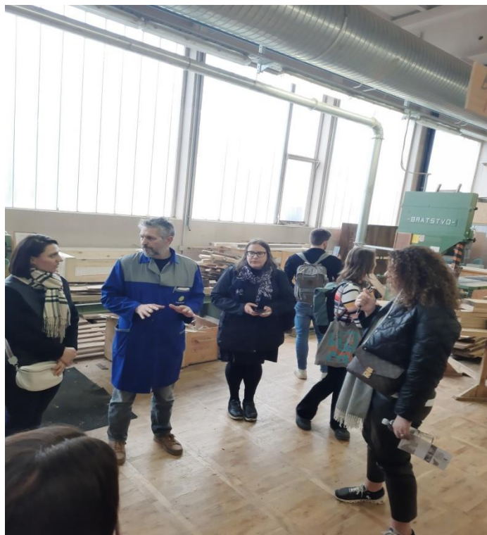
Ξενάγηση στις εγκαταστάσεις του Wood Technology School Maribor