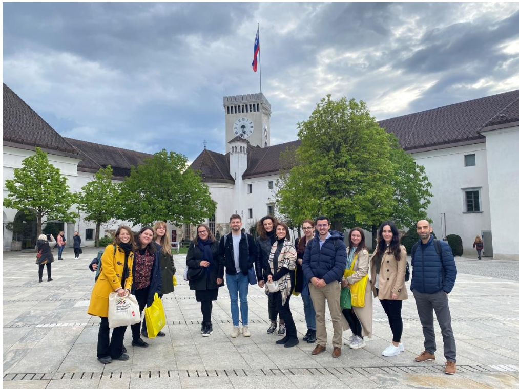
Euroguidance Study Visit “Guidance in VET”

Κλείνοντας, αξίζει να αναφερθούν τρία σημεία που ξεχώρισαν ως σημαντικά από το study visit: Πρώτον, η σημασία που δίνεται στην Σλοβενία και την Κροατία στην επαγγελματική εκπαίδευση και κατάρτιση, η οποία μπορεί να εφοδιάσει αποτελεσματικά το άτομο, όχι μόνο για να ενταχθεί εύκολα στην αγορά εργασίας, αλλά και να ακολουθήσει μια επιτυχή επαγγελματική σταδιοδρομία. Δεύτερο, η διαπίστωση από αρκετούς σύμβουλους, εκπαιδευτικούς και εργοδότες, με τους οποίους συζητήσαμε στις δύο χώρες, ότι η ένταξη στην αγορά εργασίας αμέσως μετά την ολοκλήρωση της δευτεροβάθμιας εκπαίδευσης είναι πολύτιμη, γιατί εφοδιάζει με πρακτικές δεξιότητες, επαγγελματική γνώση και πείρα, που μπορούν να αξιοποιηθούν και να προσφέρουν πολύπλευρα οφέλη στην μετέπειτα επαγγελματική σταδιοδρομία ή εκπαιδευτική πορεία ενός ατόμου. Τρίτο, η έμφαση που δίνεται από τις δύο χώρες στην συνεχή επαγγελματική συμβουλευτική και καθοδήγηση (lifelong guidance), ως μέσο για την αποτελεσματική αντιμετώπιση των επαγγελματικών προκλήσεων και μεταβαλλόμενων αναγκών του ατόμου, σε ένα διαρκώς μεταβαλλόμενο εργασιακό τοπίο.