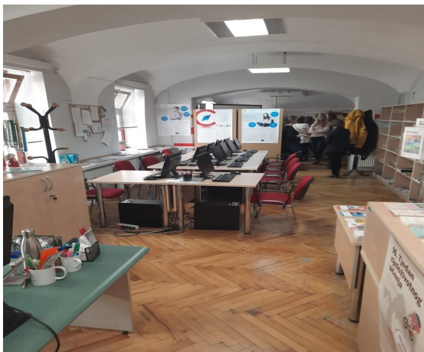
Το CISOK στο Βάραζντιν

Με επίσκεψη στο Κέντρο Πληροφόρησης και Συμβουλευτικής Σταδιοδρομίας ( Lifelong Career guidance Centre- CISOK ) στην, γνωστή για την Μπαρόκ αρχιτεκτονική της, πόλη Βάραζντιν της βόρειας Κροατίας, ξεκίνησε η τρίτη μέρα του study visit. Τα CISOC αποτελούν μέρος της Κροατικής Υπηρεσίας Απασχόλησης, και σκοπός τους είναι η πληροφόρηση και καθοδήγηση του κοινού (κυρίως αιτητές εργασίας, νέους, νεοαπόφοιτους και μαθητές) σε θέματα απασχόλησης και σταδιοδρομίας. Τα κέντρα CISOK είναι ξεχωριστές μονάδες της Κροατικής Υπηρεσίας Απασχόλησης (Croatian Employment Service - CES), δηλαδή βρίσκονται σε ξεχωριστές τοποθεσίες από τα κατά τόπους Γραφεία Εργασίας ή άλλα γραφεία της CES, έτσι ώστε να προσφέρουν μια πιο άμεση και εύκολη πρόσβαση στο ευρύ κοινό, καθώς και ένα προσιτό περιβάλλον, όπου οι πολίτες μπορούν να επισκεφτούν ανά πάσα στιγμή και να εξυπηρετηθούν από το προσωπικό του κέντρου. Το κέντρο CISOK στο Βάραζντιν ήταν ένας σχετικά μικρός αλλά «ζεστός» και «φιλόξενος» χώρος, που διέθετε πλούσιο ενημερωτικό υλικό (φυλλάδια, βιβλιάρια, κλπ) καθώς και ηλεκτρονικούς υπολογιστές για την εξυπηρέτηση του κοινού. Σε παρουσίαση τους, το προσωπικό- σύμβουλοι του CISOK μας ενημέρωσαν για τις διάφορες δραστηριότητες του κέντρου, όπως την παροχή πληροφόρησης σε θέματα εργασίας, τη παροχή συμβουλευτικής σταδιοδρομίας με τη χρήση σχετικών ψυχομετρικών εργαλείων, διάφορες διαλέξεις και εργαστήρια, και συνεργασίες με σχολεία και άλλα ινστιτούτα.