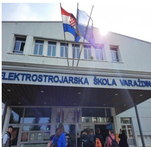
To Electromechanical School Varazdin